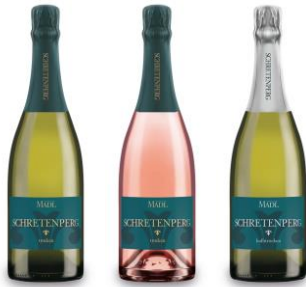
OESTERREICHISCHER SEKT HANDGEMACHT