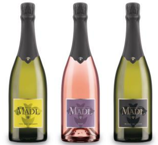
Paris Vinalies Internationales 4 Silbermedaillen VINARIA 2018/19 ausgezeichnet mit 4 Kronen Gault Millau 2016&17&18&19 unter den 5 Besten Falstaff 2018 Die besten aus Österreich